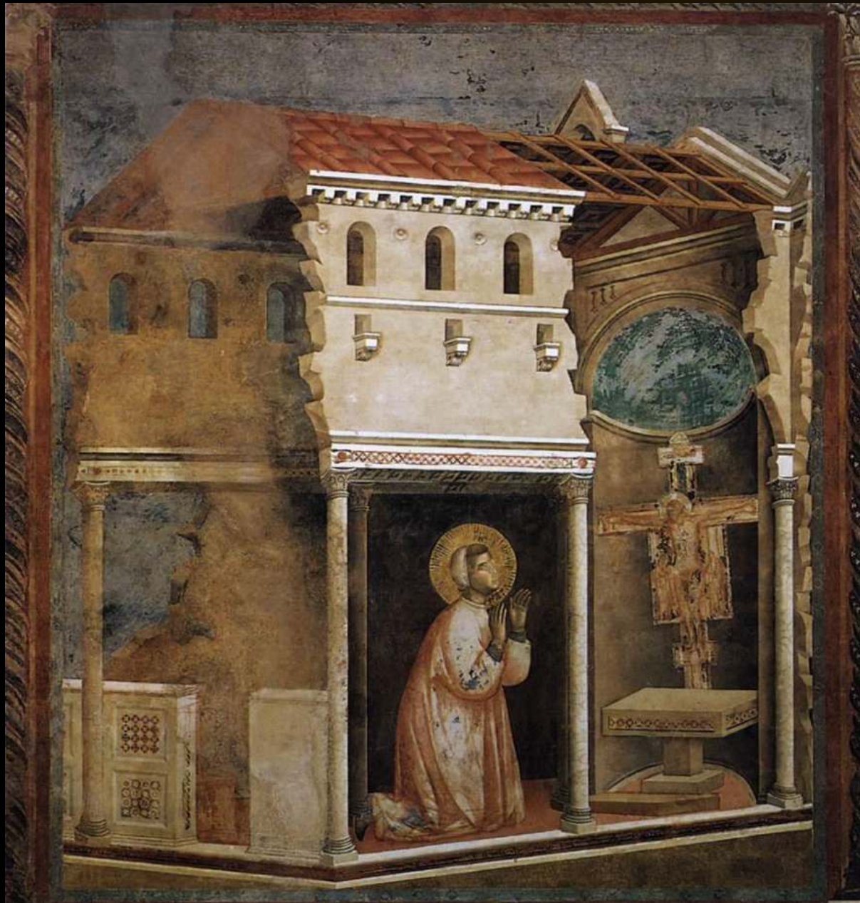
Preghiera in S.Damiano Giotto, 1290-92 circa, Basilica di S.Francesco Assisi